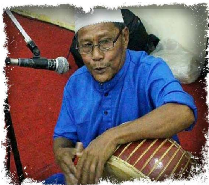
Pertunjukan tradisi lisan menggunakan bahasa daerah

Paman Fauzan tertawa, “Abidzar, seminggu yang lalu kita sudah bicara tentang bahasa daerah di rumah Paman. Masih ingat, ‘kan?”